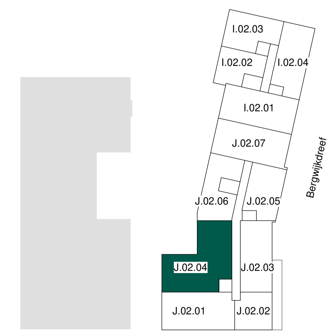
tweede verdieping schaal 1 : 500