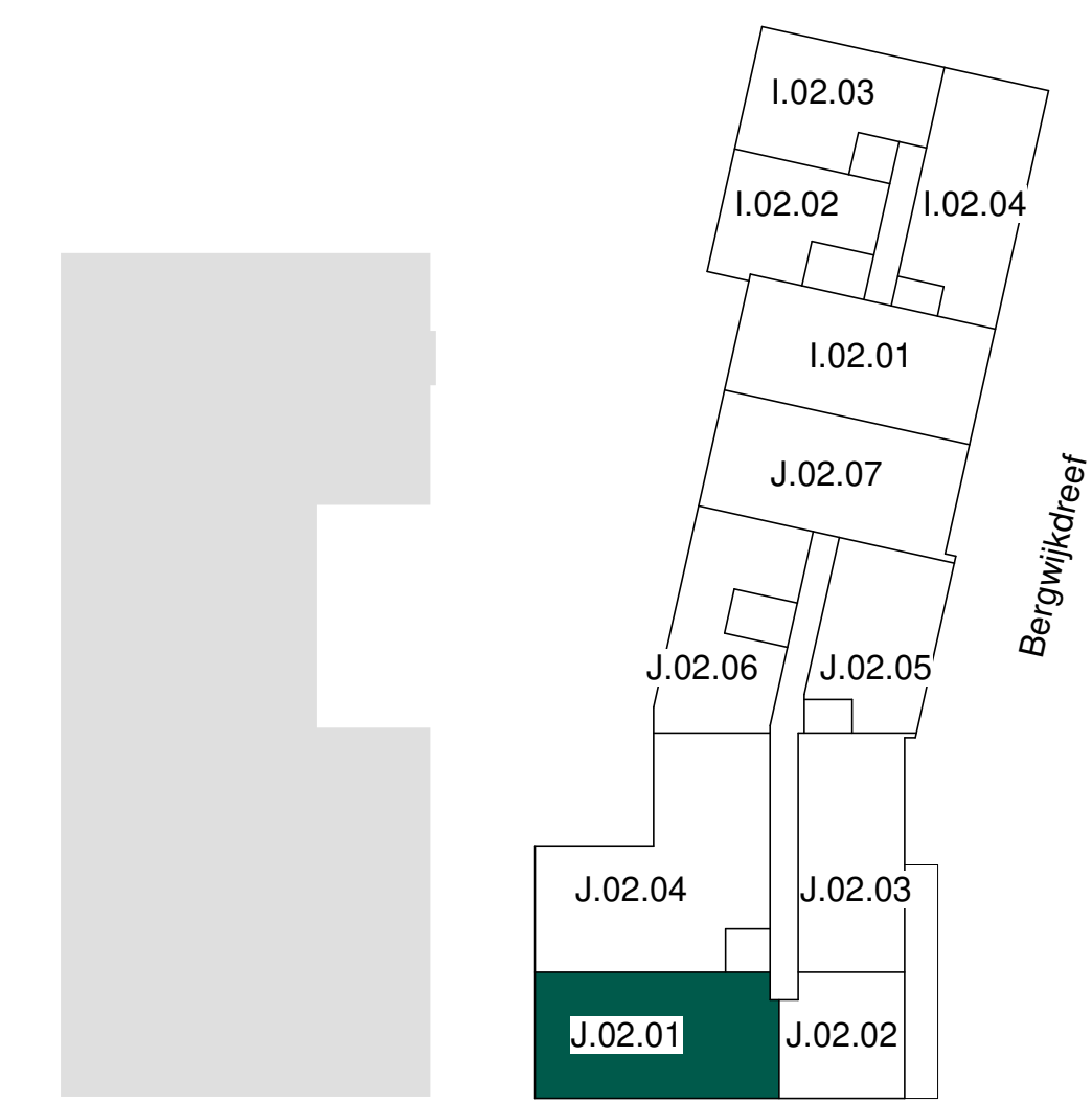
tweede verdieping schaal 1 : 500