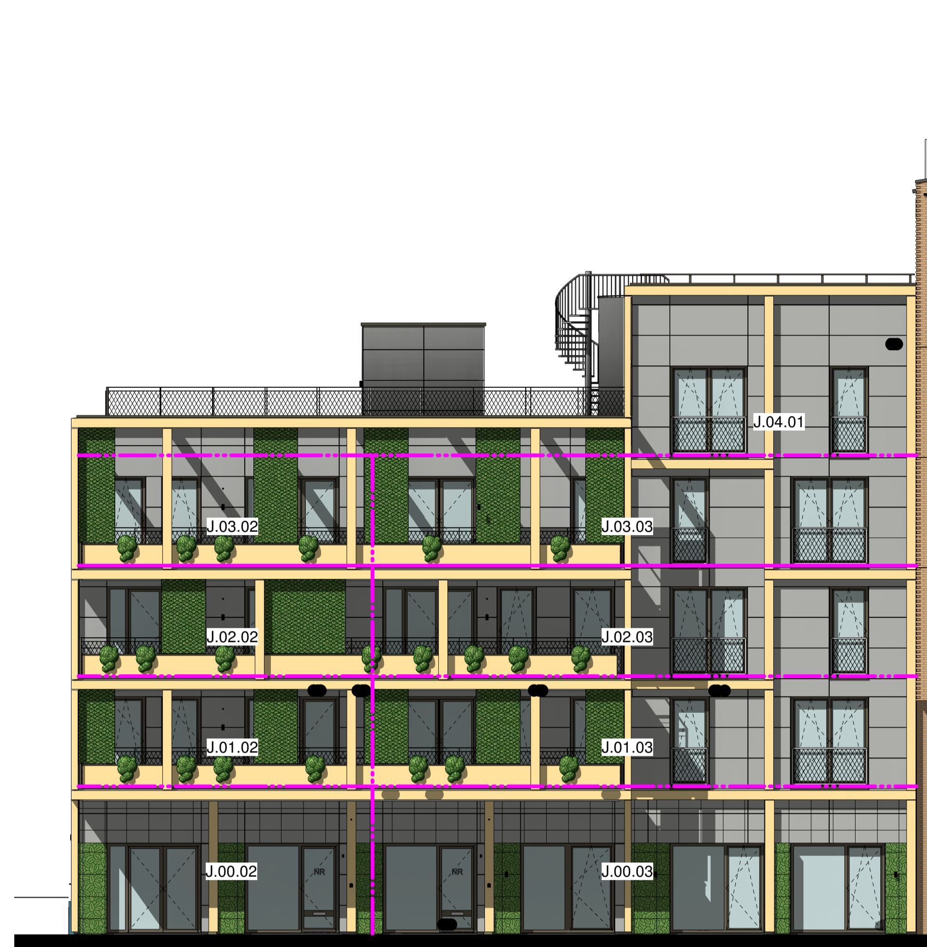
oostgevel blok J