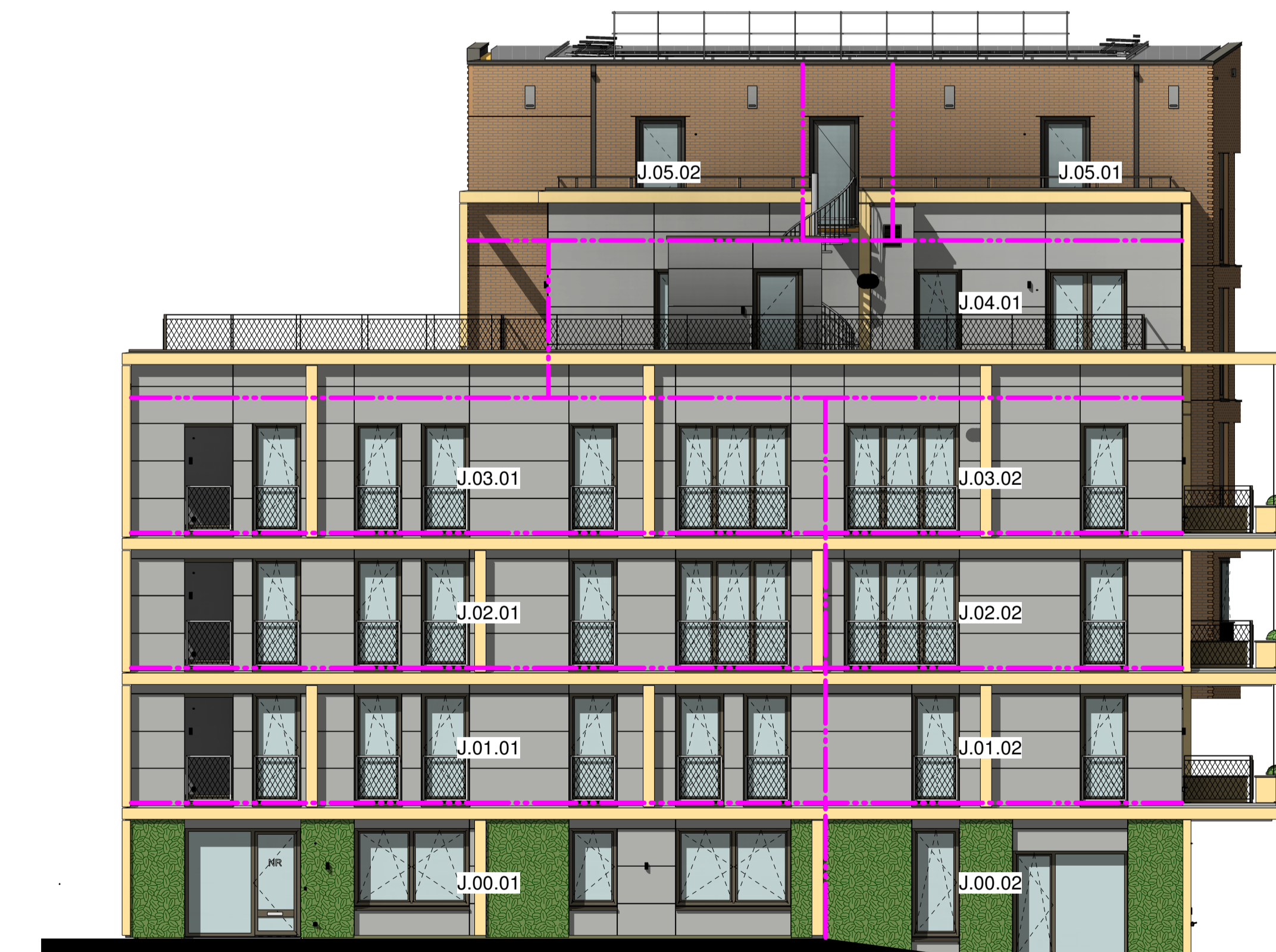
zuidgevel blok J