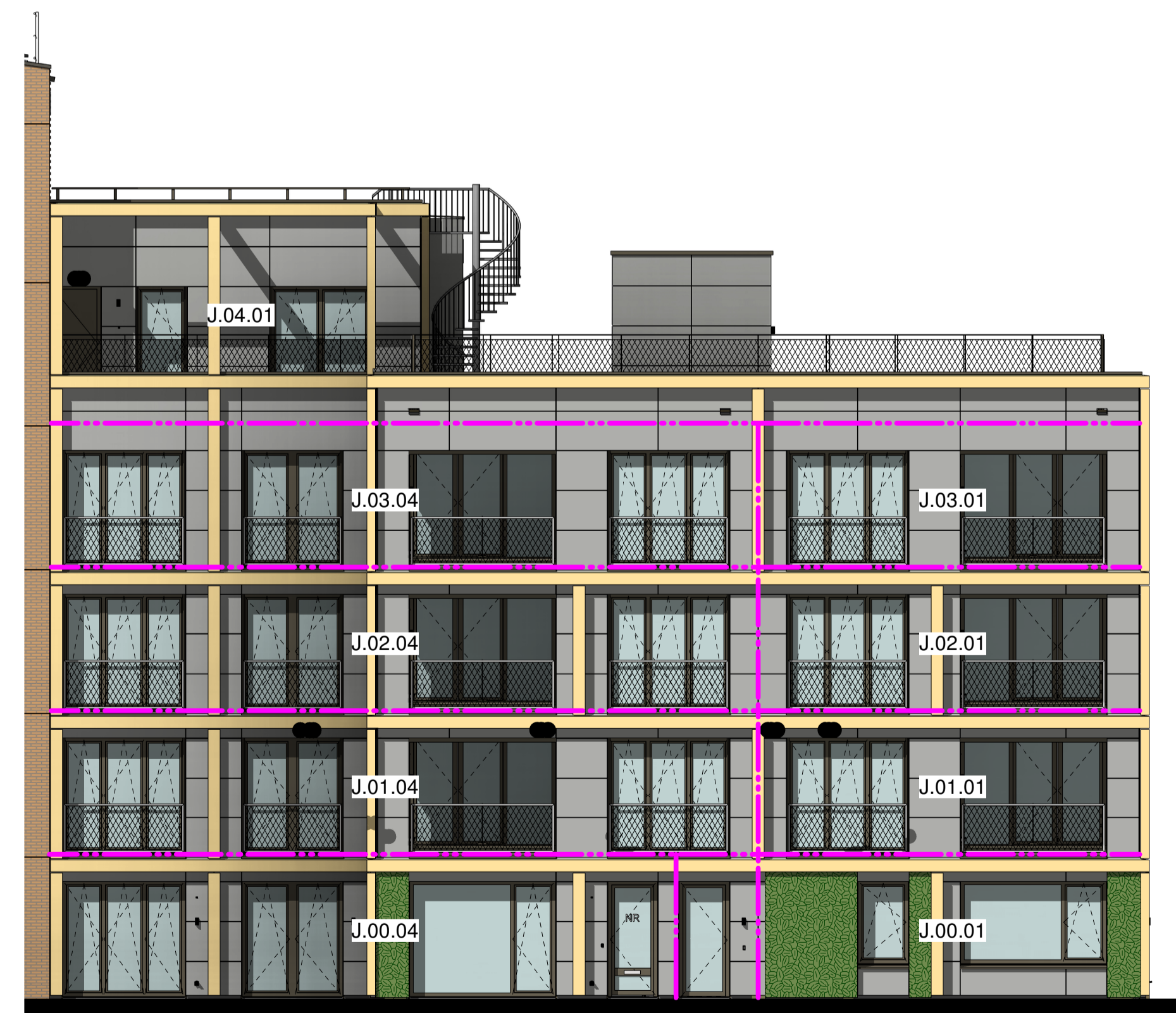
westgevel blok J