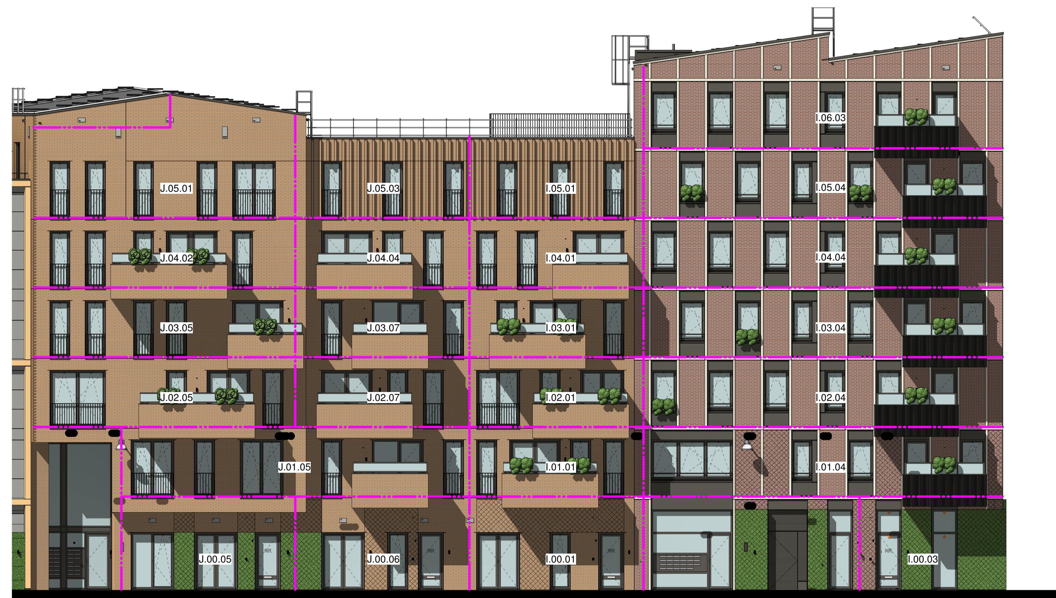
oostgevel blok I en J