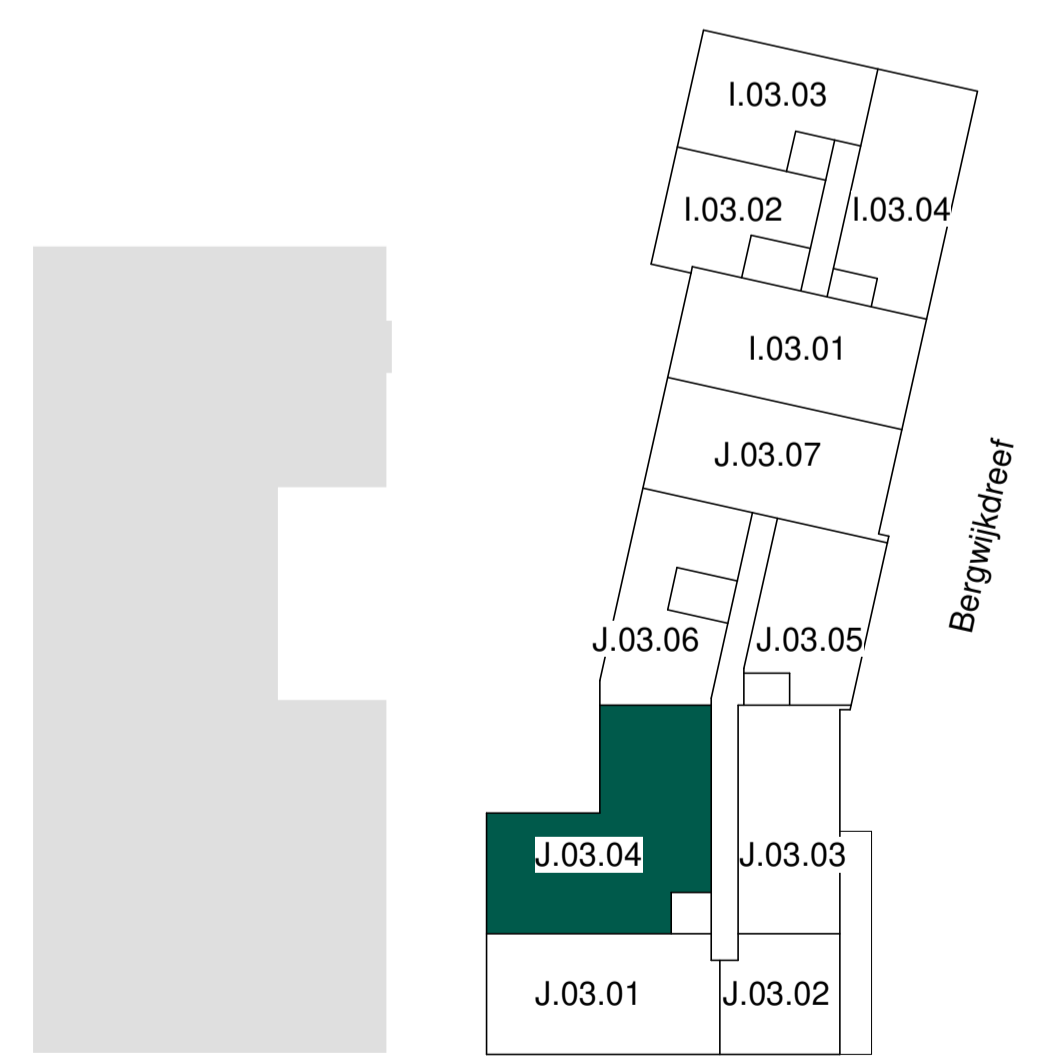
derde verdieping schaal 1 : 500